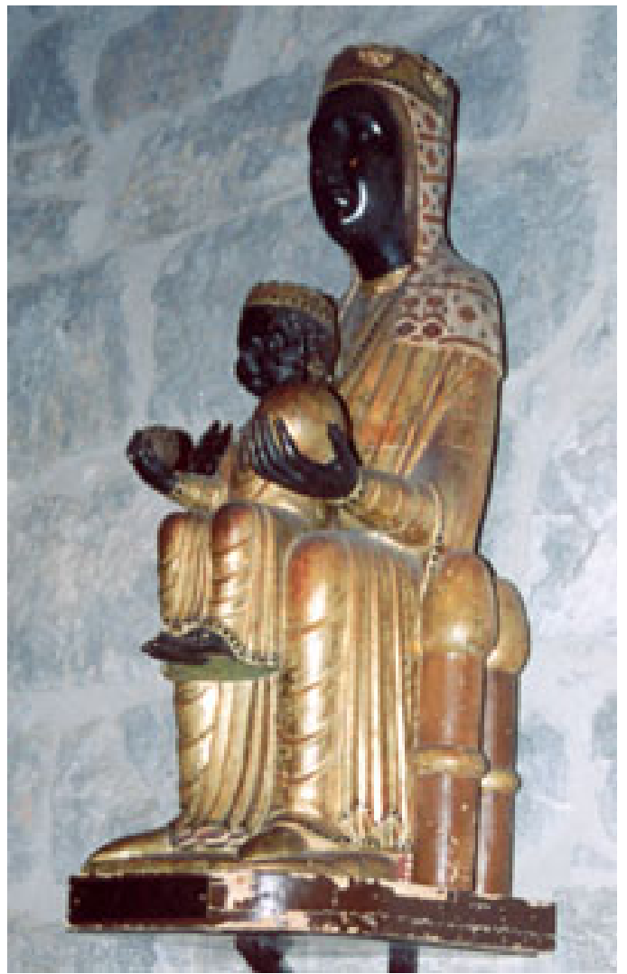
Escena de la Natividad de la puerta del Tabernáculo en la cueva de Manresa, ciudad donde Ignacio recibió un entendimiento nuevo y profundo sobre Dios. La Virgen Moreneta de Montserrat donde Ignacio estuvo una vigilia la noche antes de ir a Manresa

La experiencia de los Ejercicios está basada en una convicción firme de que Dios se revela en nuestra experiencia de vida y mediante ella. Ignacio se ve como peregrino y su proyecto de vida es su peregrinación.