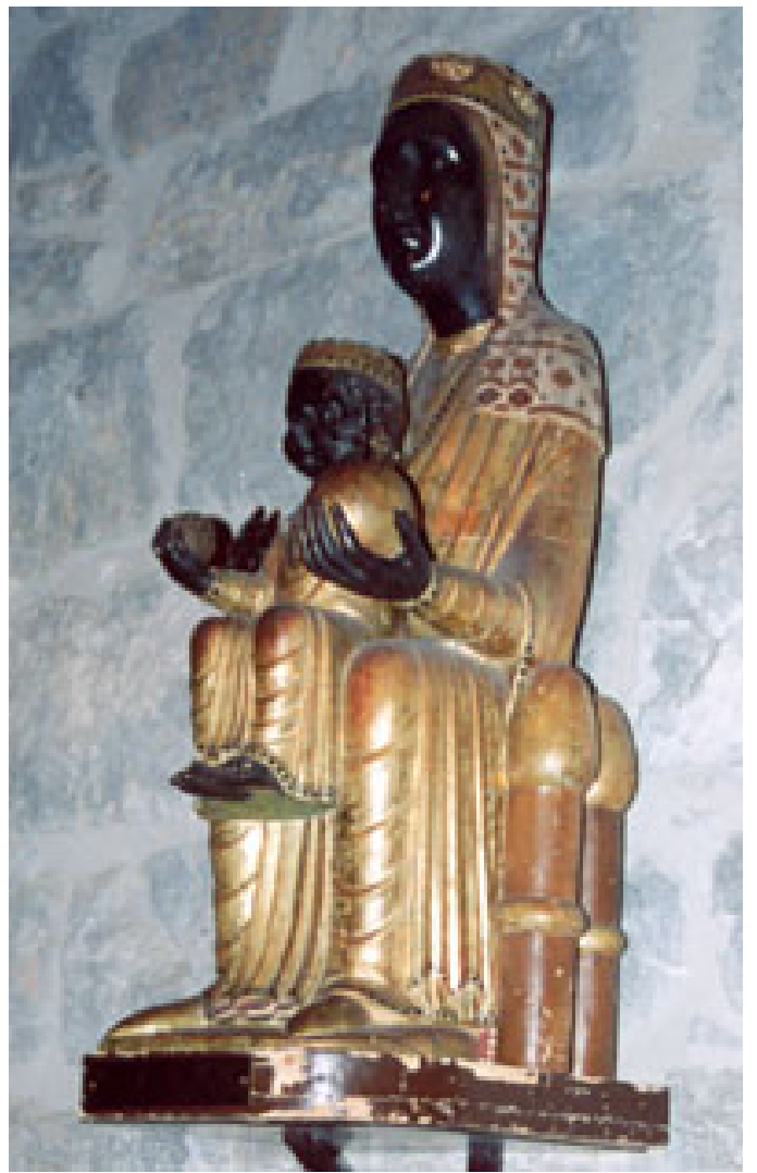
Scène de la Nativité gravée sur la porte du tabernacle dans 'la cave' à Manresa, un lieu où Ignace reçut une compréhension nouvelle et profonde de Dieu. La Vierge noire à Montserrat où Ignace fit une veillée d'armes la nuit avant qu'il ne se rende à Manresa.

La ferme conviction que Dieu se révèle à nous à travers notre expérience de vie est la base de l'expérience des Exercices. Ignace se vit lui-même comme un pilgrim et son projet de vie comme un pèlerinage .